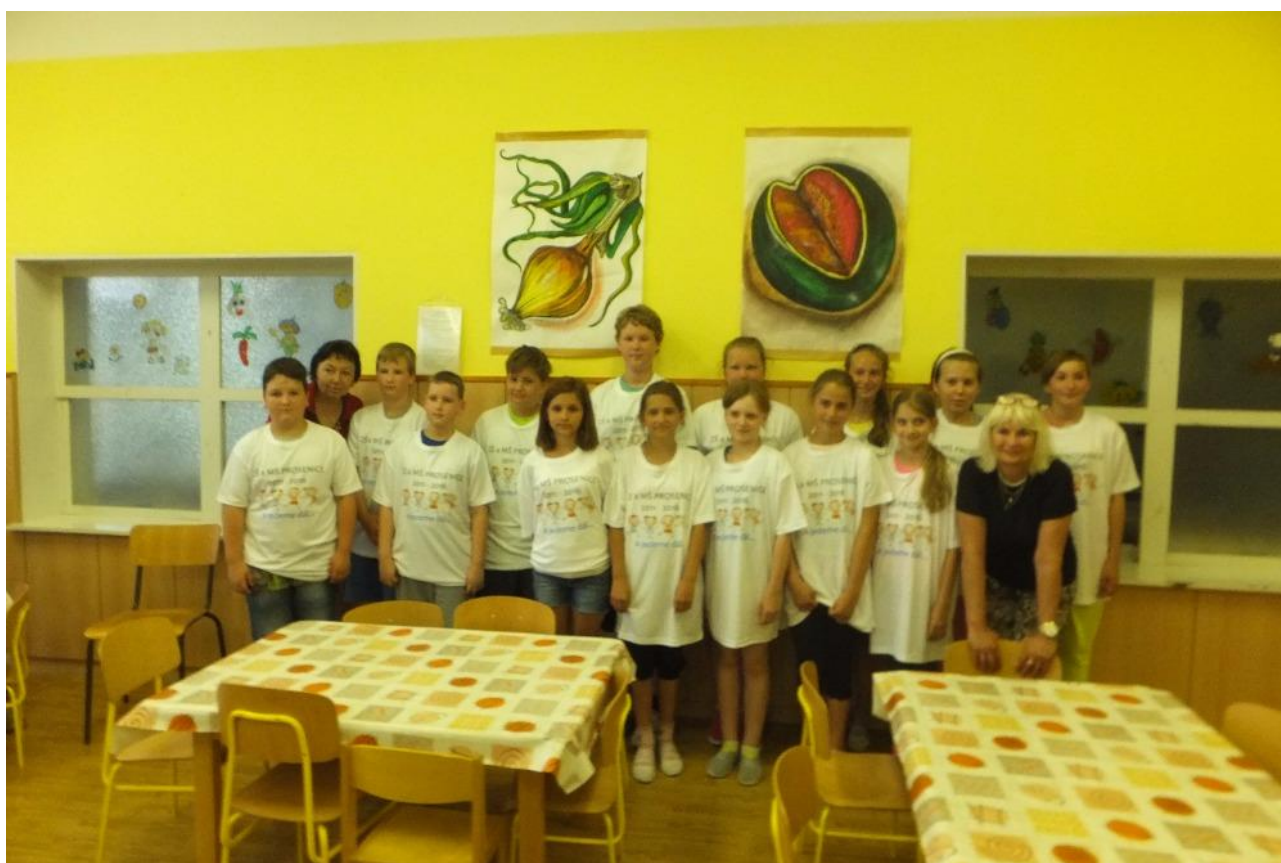
Rozloučení s 5.ročníkem

Škola je zapojena do celostátních projektů - školní mléko a projektu ovoce do škol.