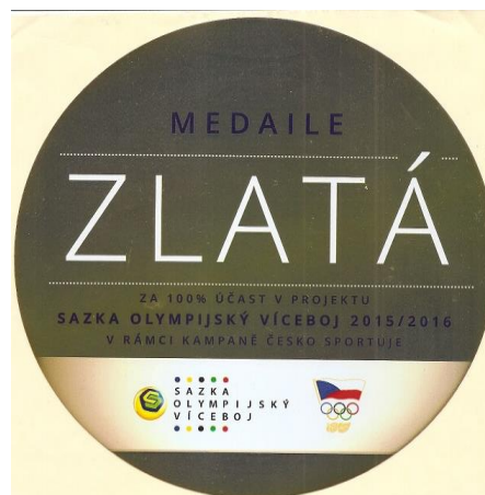
Ocenění – Olympijský víceboj

Výsledky vzdělávání jsou v souladu s výukovými cíli. Ve výuce pokračujeme nadále soustavně v uplatňování aktivizujících forem a metod práce (skupinové a projektové vyučování, aktivní a prožitkové učení, individuální přístup pedagogů k žákům, rozvoj jednotlivých klíčových kompetencí), které korespondují s obecnými cíli a záměry školství a rámcovými vzdělávacími